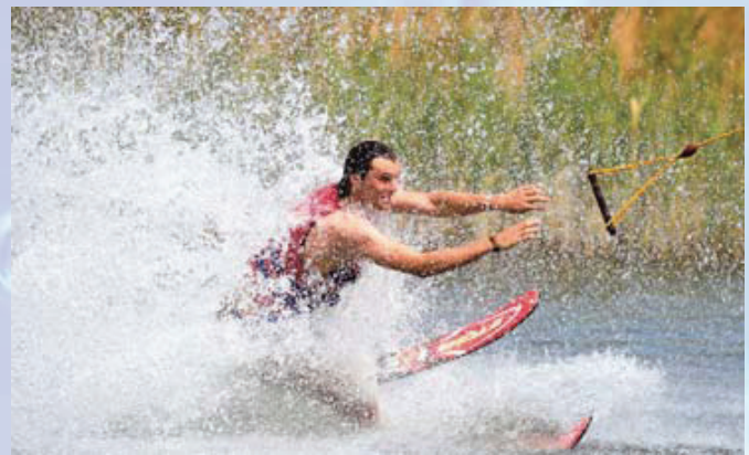
Wasserski-Fahren macht Spaß und sorgt für Abkühlung an heißen Tagen.

Auch für den Angelsport hat das Wasser vielseitige Einsatzmöglichkeiten; sei es das Wildwasserfischen, Hochseefischen